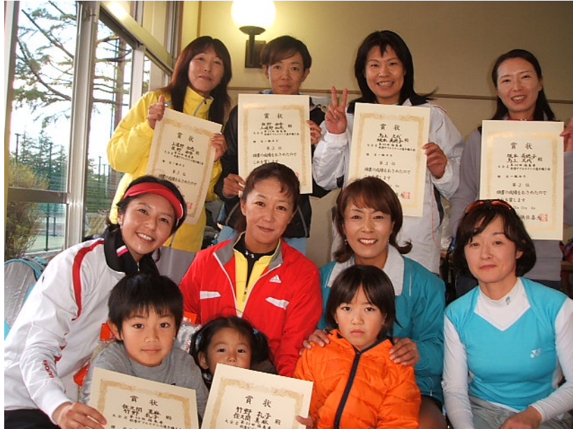
一般女子上位入賞者