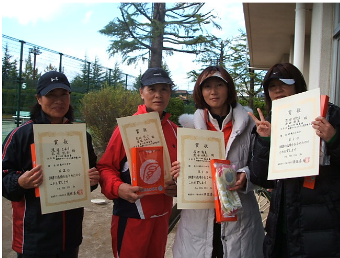
45歳以上女子上位入賞者