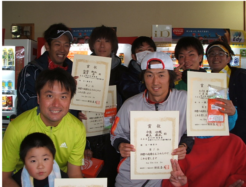
一般男子上位入賞者