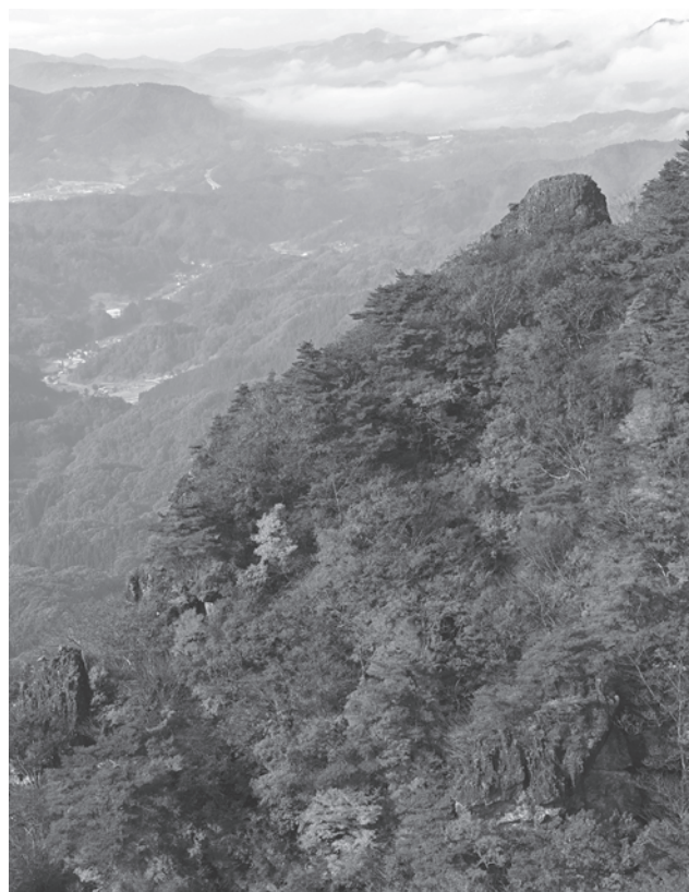
霊山（伊達市霊山町）