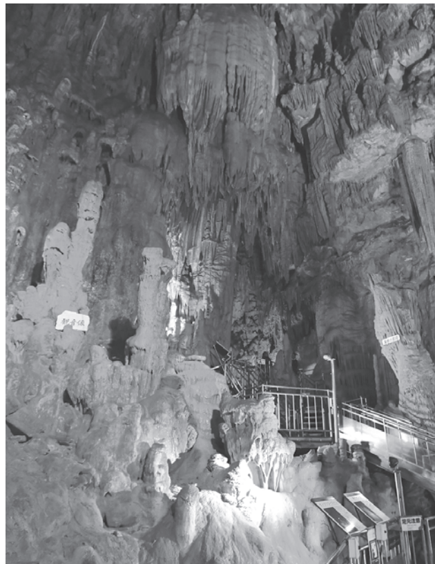
あぶくま洞（田村市滝根町）